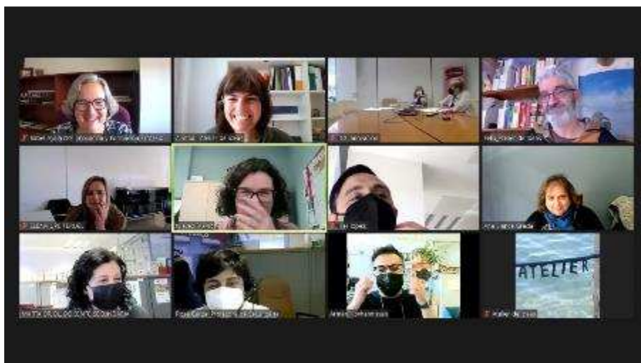
Imagen 1- Momento de la sesión participativa

La facilitación y dinamización de la sesión corrió a cargo de Félix Rivas y Ainhoa Estrada de Atelier de Ideas S.Coop.